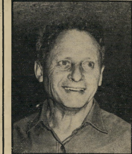
דן עומר ימין בעולם, שמאל בישראל

זה יפגע, אולי, בהנחת-היסוד הבכינית של מגד על העולם המכור לנפש והאנטי-שמי, אבל כל ביט-אוני השמאל בבריטניה תמכו בהקרנת הסרט, ופיר-סמו עליו ביקורת נלהבות.