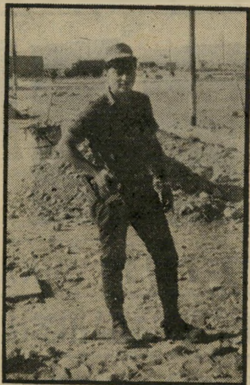
יורד ברק האשה הביאה אזרחות

במישרד-השיכון טוענים, כי הם התח- לו לאחרונה תוכנית העומדת על סף ביצוע. המדובר בפרויקט של בניית דירות להשי-