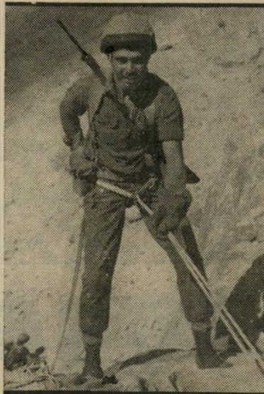
יורד מן דרך אמריקה לפיליפינים

שנתיים שלוש של היעדרות. מבחינה סטטיסטית מרגע כניסתו לארץ הוא מר- סיק את רצף הירידה. יש לערוך אכנה ברורה בין יורדים שעזבו את הארץ על רקע מיקצועי לבין יורדים שעזבו אותה בשל סיבות אחרות. אי-אפשר להכליל מדענים ישר- אליים בחו"ל, שחלקם יצא להשתלמות או לשנת שבתון, בנשימה אחת עם נהגרי מוניות, שהיגרו מסיבות אחרות. יש להב- חין בין עולים שעלו לארץ ויורדו לבין ילידי הארץ או ותיקים שירדו ממנה. יש