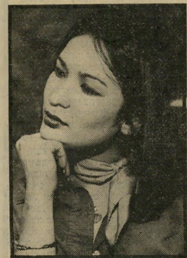
קריינית חיים מירושלים לנתניה