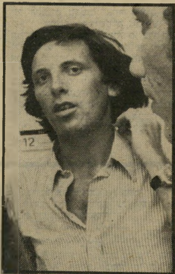
כתב סממה הסקופ הוחמץ

אפשר כמובן להאשים את הבמאי, את המפיק, את התפאורן או את החשמלאי של המופע. אולם אין ספק כי האשם העיקרי