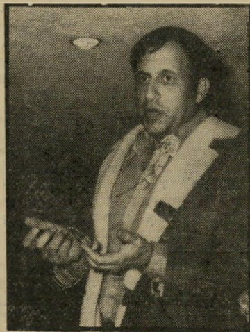
מנהל חסון לא מבין רמזים

כשיצא כתב לערוך כתבה עבור השבוע, הוא לא יעביר שום חומר מכתבה זו ל-