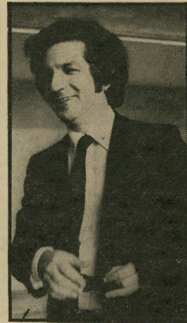
פרקליט זיבאי — ושום עניינים