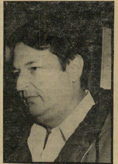
מנהל לביארי הסדרות ושתיקה