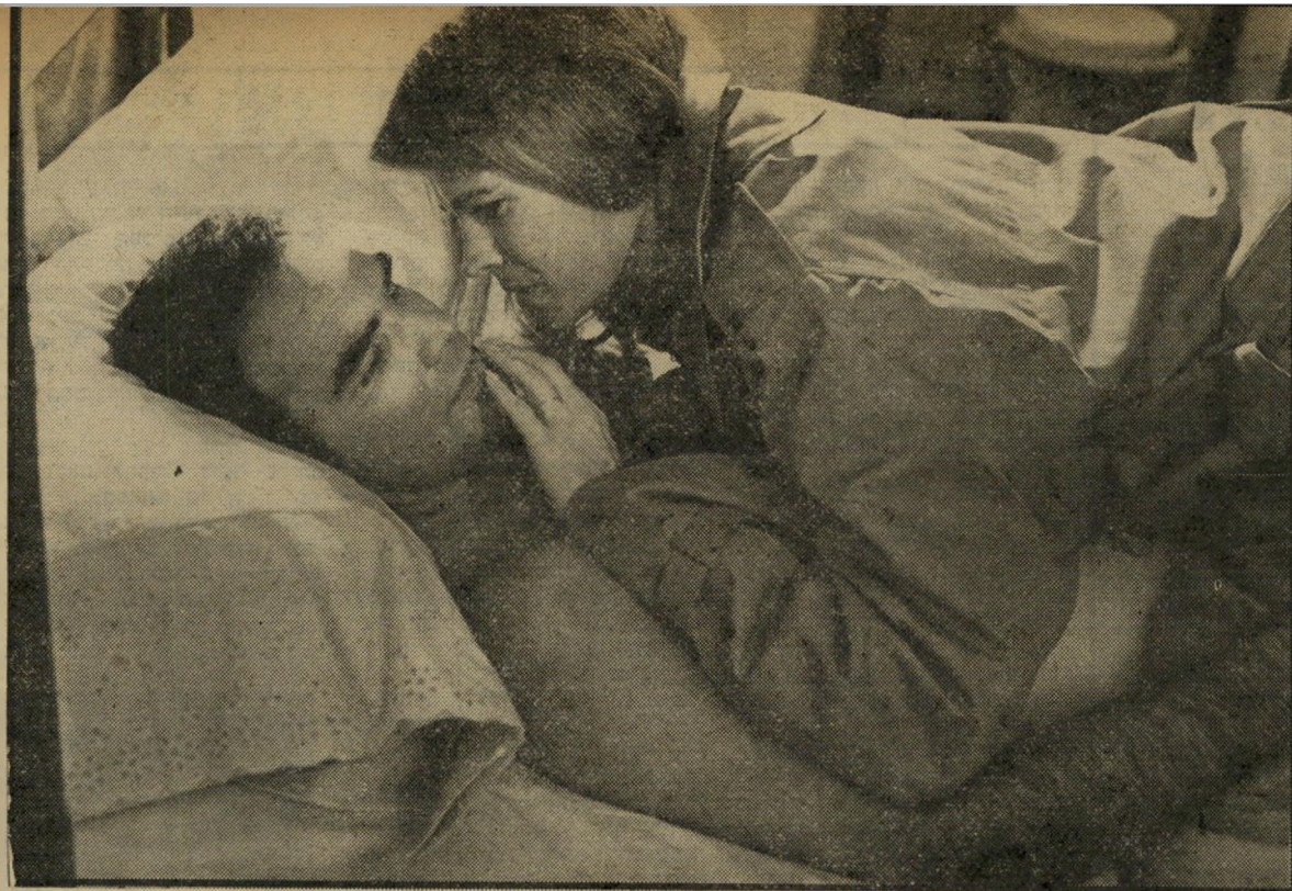
ברט ריינולדס, בתפקיד פוטר, עם גרושתו קנדיס ברגן הראשונה — יפה עד כדי סינוור עיניים

כמאי אינטליגנטי. למולו של סרט זה גם בו, כמו בקרמר נגד קרמר, האיש שניצב מאחרי המצלמה הוא אדם נכון.