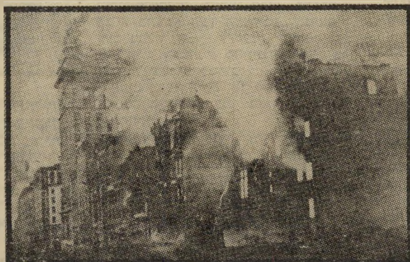
רעידת-אדמה בסן-פרנסיסקו 18.4.1906