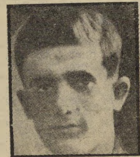
מרדכי אניליביץ 19.4.1943

19.4 — 5,000 מפציצים זורעים הרס בגרמניה במהלכה של יממה אחת. במשך כל חור דש אפריל עורכים מפציצי הי