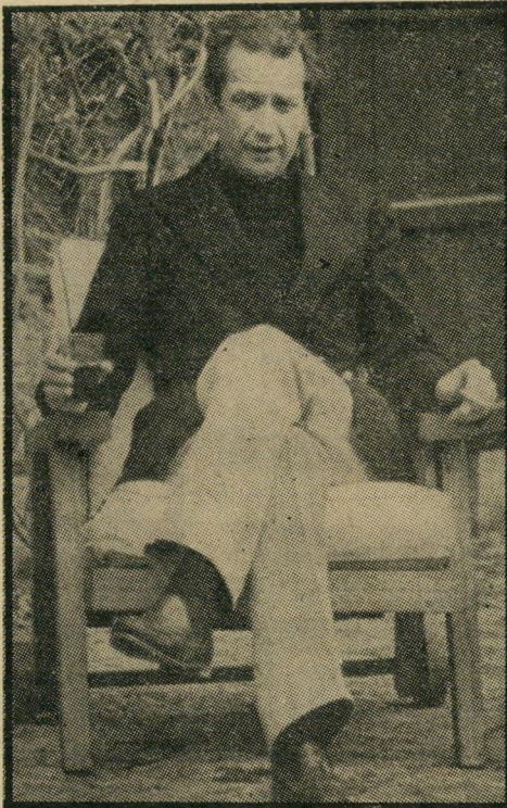
הנסיך אלברט: לי או לבני?