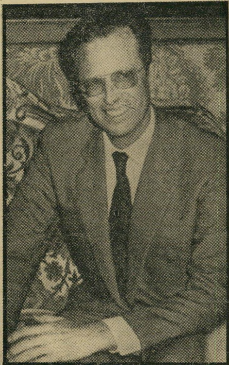
המלך בודואן: הירירו פרישה?