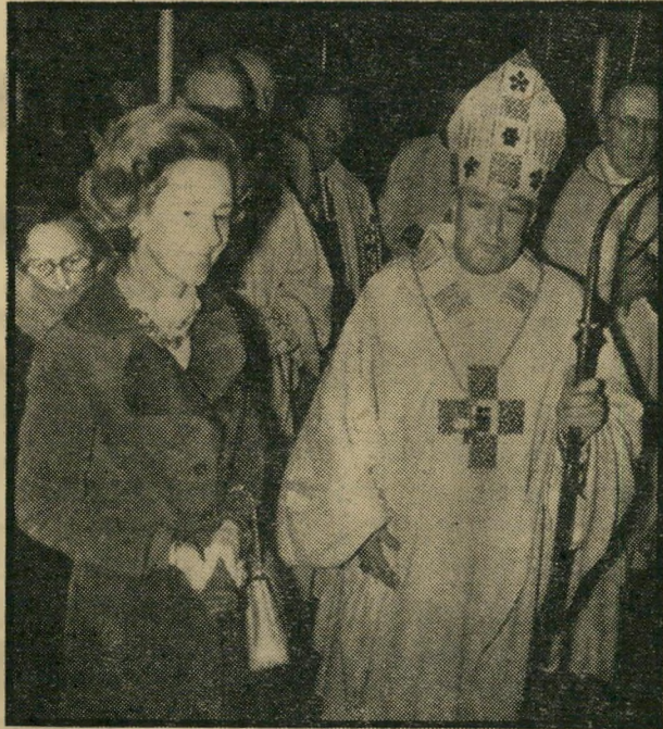
המלכה פאביולה עם ראש הכנסייה הקאתולית בבלגיה

בודואן שהיה מאו ומתמיד טי- פוס מסוגר ובעל הליכות שקטות, ורעייתו פאביולה, קאתולית דתית, לא הצליחו להביא ילדים לעולם. הם נהגו באחיו הצעיר של בודואן ובפאולה, רעייתו היפהפיה, כביל- דיהם המאומצים, אבל נראה כי בודואן רואה בשניים ילדי שעשור- עים לא רציניים די הצורך. לעומת זאת הוא נוטה אל פיליפ שחונך כיוורש-עצר לכל דבר. הוא למד תשע שנים בבית-ספר ישועי והיום עושה את שירותו הצבאי. גילו זהה בדיוק לגיל שבן קיבל בודואן את המלוכה: עשרים שנה.