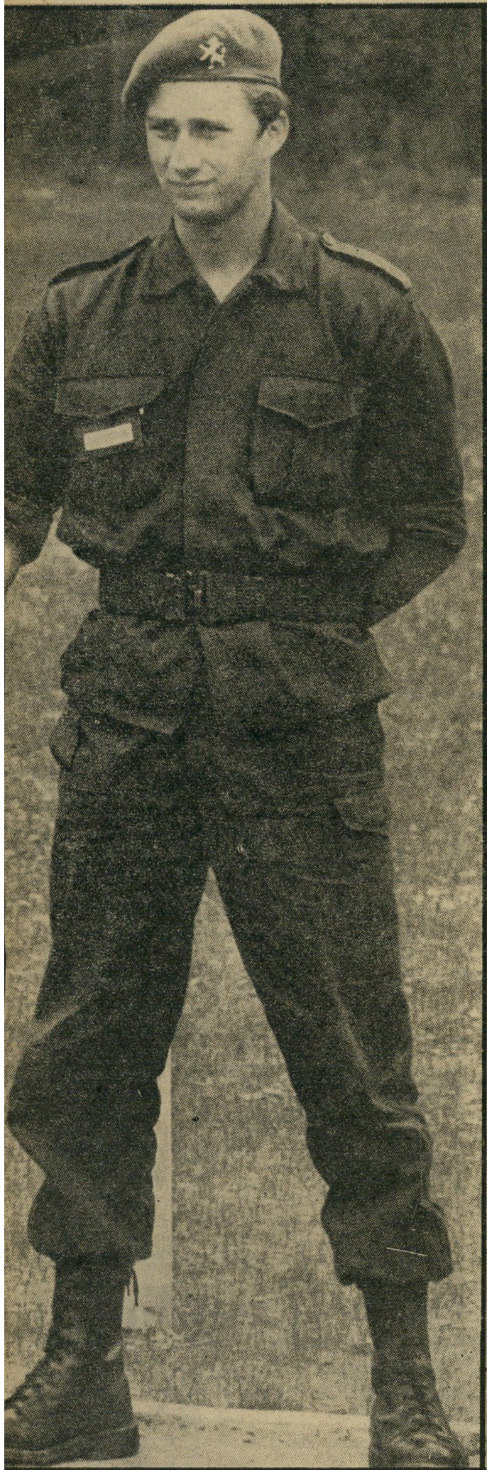
הנסיך פיליפ, בנם של אלברט ומאולה: חייל או מלך?