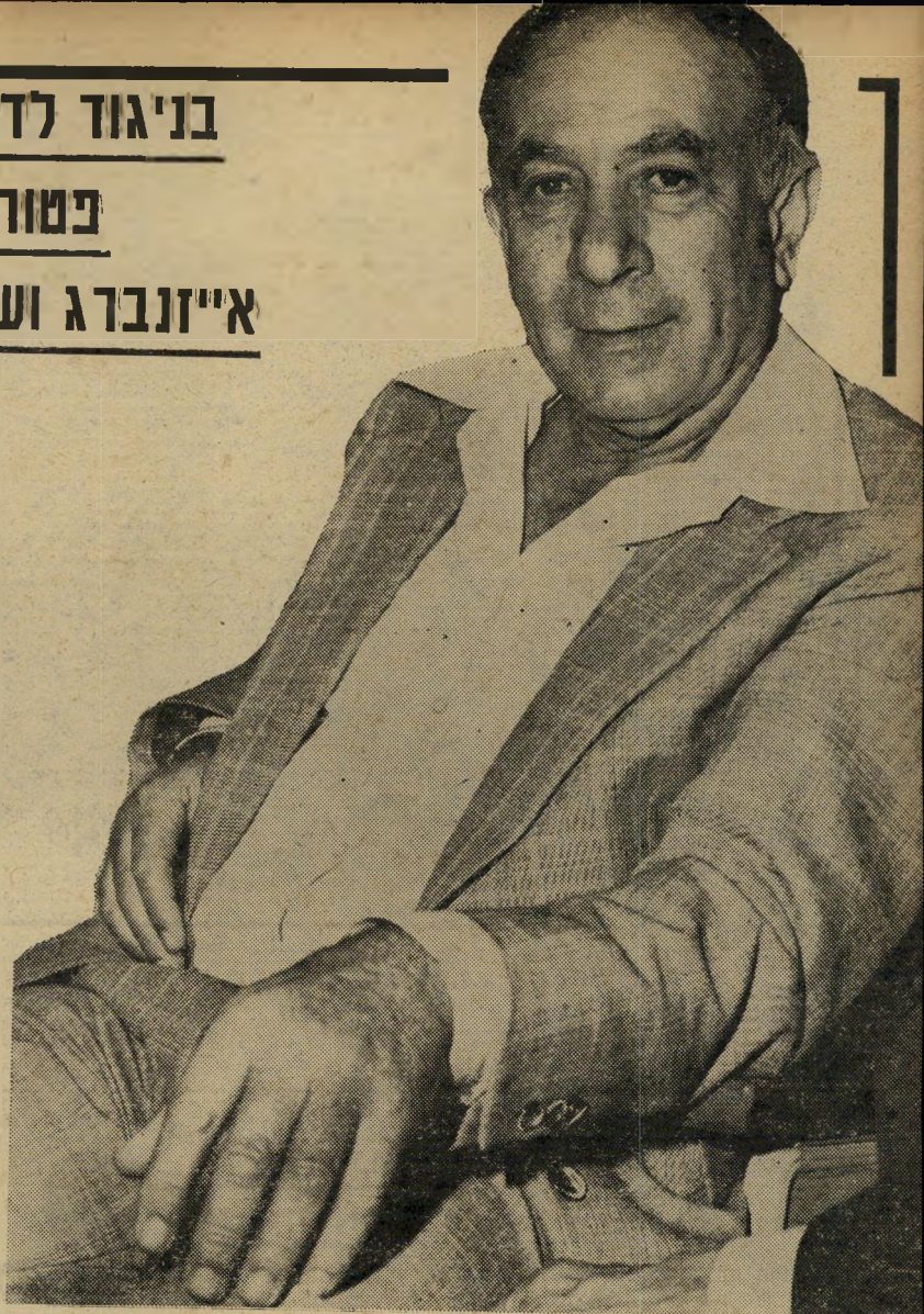
שרי-אוצר הורביץ מישרדים ללא שלט

בה לא תתקבל אלא על-ידי ועדת השרים ויצויין במפורש בפרוטוקול הישיבה, כי לשר פלוני היה עניין אישי בהחלטה זו וכי אותו שר לא השתתף בדיון ובהחלטה. במקרה שהחלטה חייבת על פי דין להתקבל על-ידי נושא מישרה הכפוף לשר, תובא ההחלטה לאישור ועדת שרים."