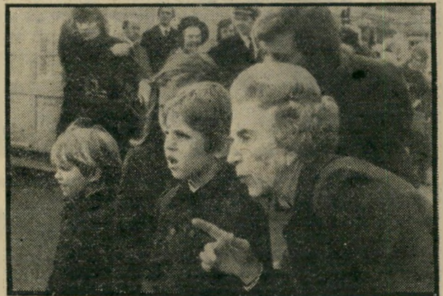
המלכה-האם אינגריד, מדנמרק (אמה של אן-מארי) ונכדיה.

משנפגשו סופי וחואן-קרלוס, הזוג המלכותי הספרדי עם ביאטיקס וקלאוס, הזוג המלכותי הווי-לנדי, מצאו המלכות הצעירות שפה משותפת: שתיהן בנות אותו ה"גיל, סיפורי נישואיהן כרוך בסיפורי-אהבה גדולים, ולשתיהן שלושה ילדים, בני גיל זהה כמעט. הפגישה המלכותית של הילנדו-ספרד היוותה כמעין חותמת כשרות סופית לשלטונם העתידי של ה"צעירים.