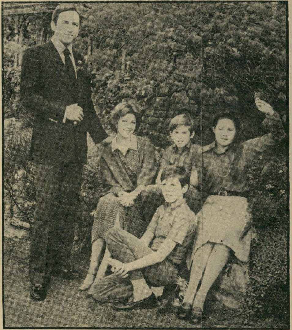
המלכה-הגולה, קונסטאנטין, עם רעייתו, אן-מארי, וילדיהם אלכסייה (הבכורה, קיצונית מימין), פול (יושב לידה) וניקולאס (יושב למרגלותיהם).