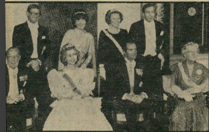
המלכות יוליאנה, סופי מארגרט (מעל סופי) וביאטריקס והבעלים.