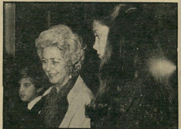
המלכה-האם פרדריקה, מיוון (אמו של קונסטאנטין) ונכדיה.