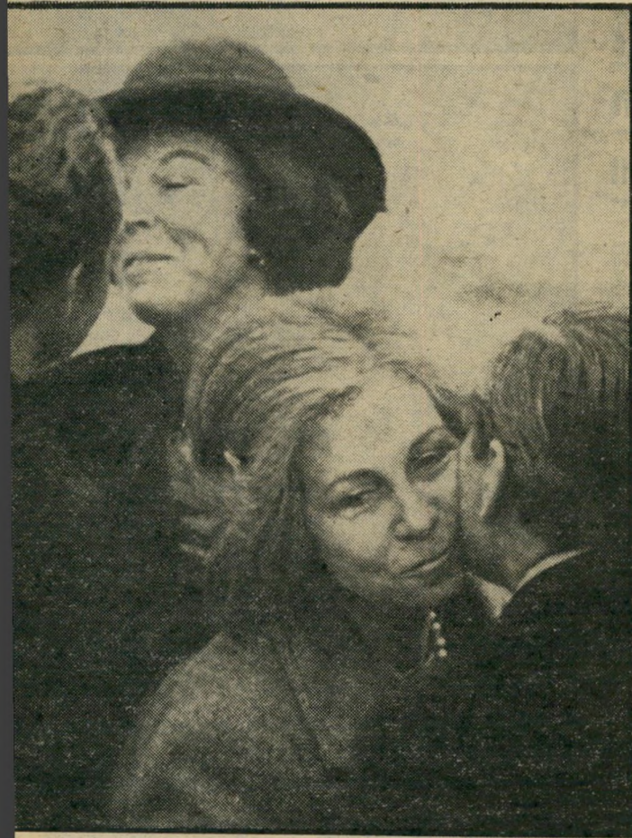
המלכה לעתיד בהולנד, ביאטריקס, נושקת לחואן קארלוס, כשהמלכה סופי נושקת לבעלה של ביאטריקס, הנסיך קלאוס.