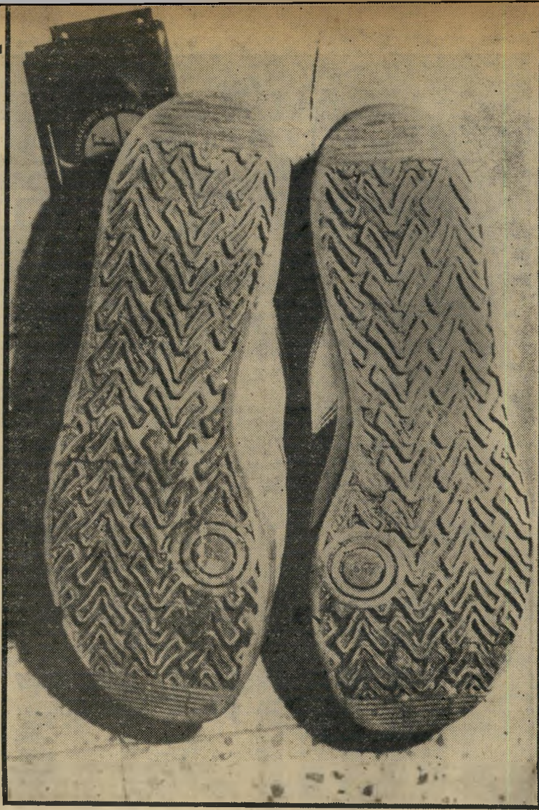
הסוליות המרשיעות מספיק סימני זיהוי

בעלת מיבנה מסויים, אלה הם מאפיינים פרטיים, שלא יחזרו בנעל אחרת. מעבדות המיטרה מגדילות תשליל של העיקבה לגודל המקורי של הנעל, ואז מציבים את הנעל על התשליל ומשי-וים ביניהם. כך אפשר לראות בדיוק אם נקודות האפיון מונחות זו על זו, ואם כולן קיימות בשני העצמים. חלקיקים זרים אחרים, כמו אבנים קט-נות, בוץ או חלקי צמחים, חשובים גם הם לזיהוי, וחשוב לכן, כי הנעל תימסר לבדיקה סמוך ככל האפשר למועד טביעת העיקבה.