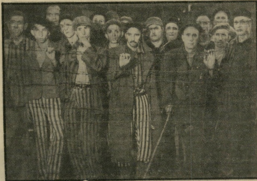
אסירי מחנה בוכנוולד, 10.4.1945

המכביה השניה, בהשתתפות מישלחות ספורטאים מ-27 ארצות.