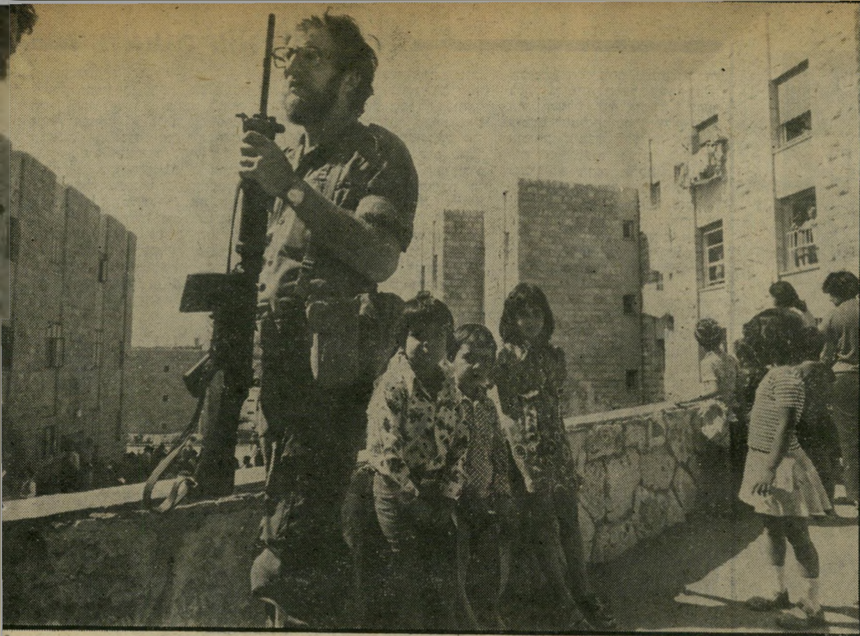
חייל שומר על ילדי קריית-ארבע כמה תעלה השמירה בחברון

כ אשר יצא שריהווחה, הד"ר ישראל כץ, משיבת הממשלה האחרונה, הוא מילמל, בקול רם מספיק כדי שעתונאים ישמעו אותו: "הם אומרים שזה יעלה 100 מיליון לירות." ה"הם", שאליהם הת- כוון כץ, היו השרים בראשותו של שר הבינוי, דויד לוי, שהגישו לממשלה את תוכנית יישוב שני הבתים בחברון על-ידי יהודים.