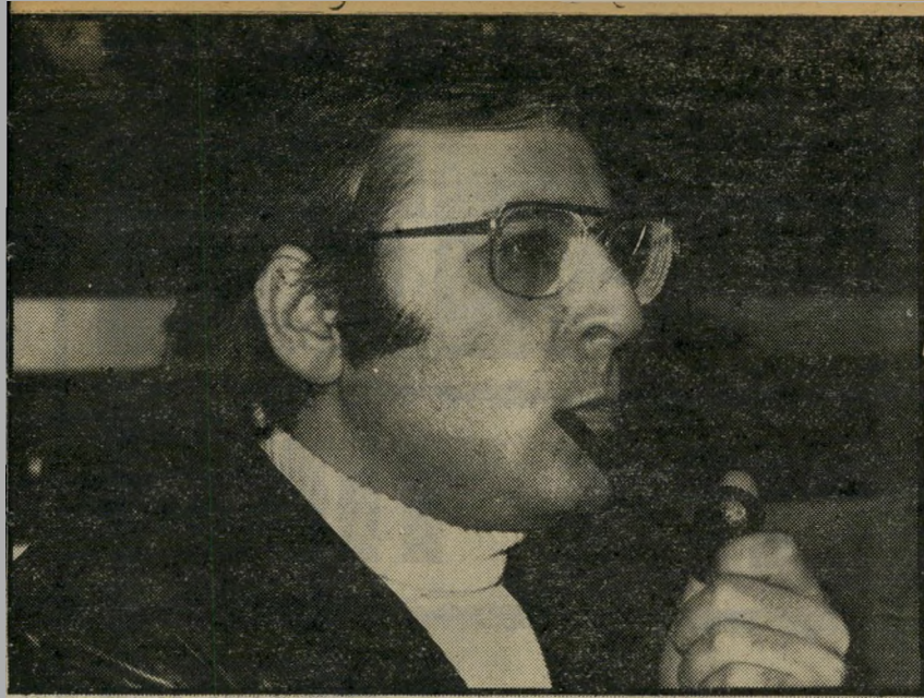
עוזר ספיר עבור 33 אלף לירות