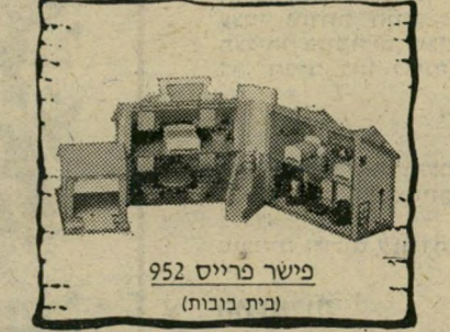
פישר פרייס 952 (בית בובות)