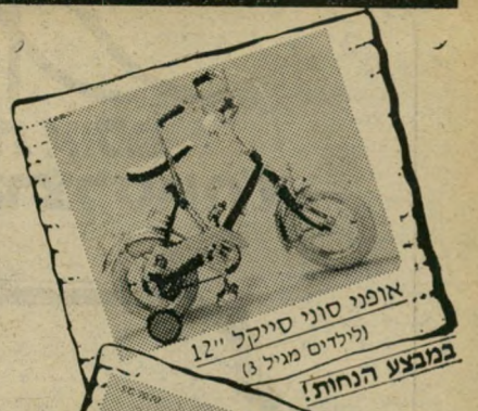
אופני סוני סייקל 12" (ילדים מגיל 3) במבצע הנחות!

פרס ראשון של סוכנויות קופמן לחג יציאת מצרים - כרטיס טיסה הלוך ושוב למצרים.