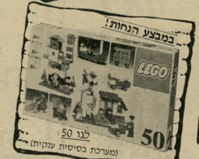
במבצע הנחות! לגו 50 (מערכת בסיסית ענקית)