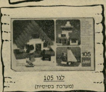
לגו 105 (מערכת בסיסית)