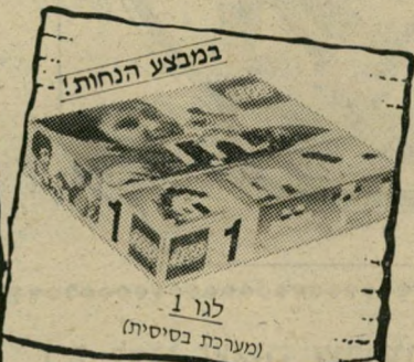
במבצע הנחות! לגו 1 (מערכת בסיסית)