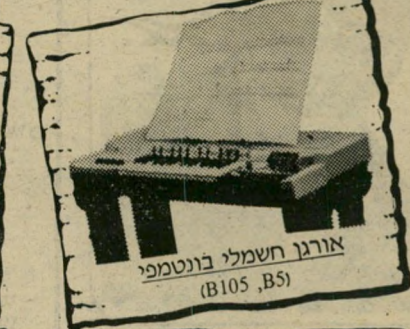
אורגן חשמלי בונטמפי (B105, B5)