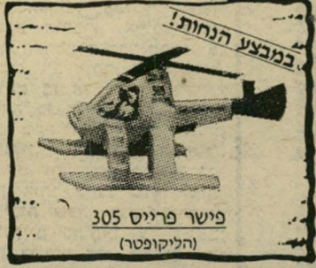
במבצע הנחות! פישר פרייס 305 (הליקופטר)