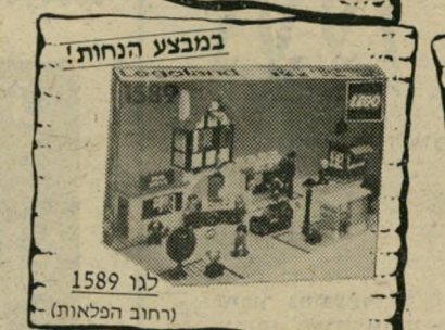
במבצע הנחות! לגו 1589 (רחוב הפלאות)