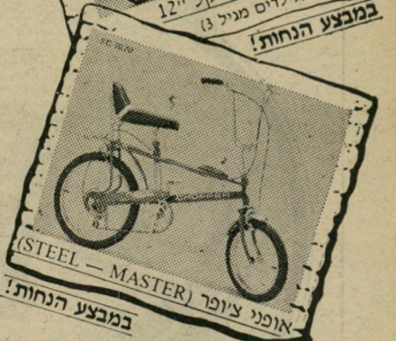
אופני צ'ופר (STEEL - MASTER) במבצע הנחות!