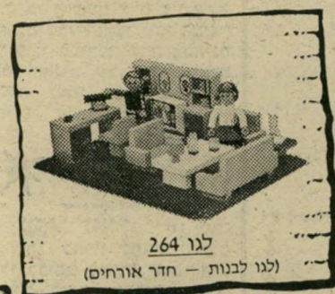
לגו 264 (לגו לבנות - חדר אורחים)