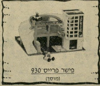
פישר פרייס 930 (מוסד)