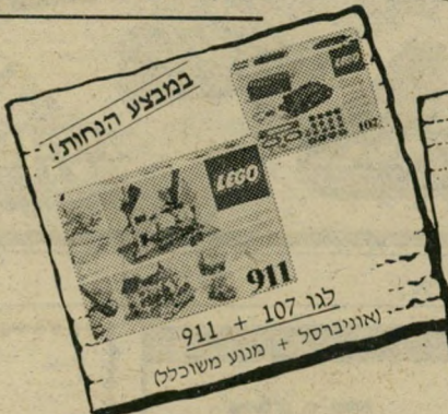
במבצע הנחות! לגו 911 + 107 (אוניברסל + מנוע משוכלל)