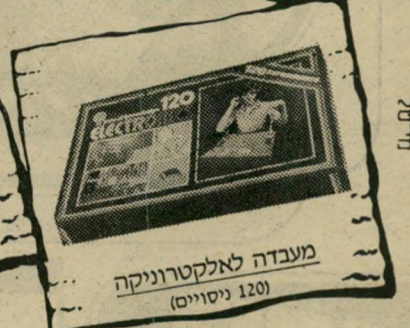
מעבדה לאלקטרוניקה (120 ניסויים)