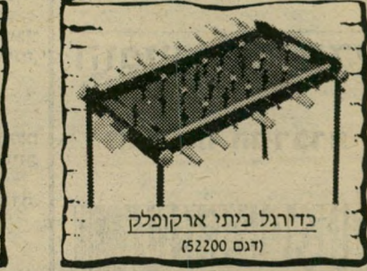
כדורגל ביתי ארקופלק (דגם 52200)

כל הרוכש אחד מן הפריטים המופיעים במדעה, זכאי להשתתף בהגרלת פרסים יקרי ערך שיוגורלו במבצע "אפיקומן לבסח" של סוכנויות קופמן בע"מ: פרס ראשון: כרטיס טיסה הלוך ושוב למצרים פרס שני: אופני צ'ופר 3 מהלכים (STEEL - MASTER) פרס שלישי: "חבילה" משגעת לגו 911 אוניברסל + לגו 107 - מנוע משוכלל פרס רביעי: אופני סוני סייקל 20" פרס חמישי: אורגן חשמלי בונטמפי (B105) פרס שישי: שולחן כדורגל ביתי - ארקופלק (דגם 52200) סוכנויות קופמן בע"מ תל אביב: רח' החשמונאים 105 טל. 6-268155 אולמי תצוגה: ת"א, מגרשי התערוכה, סוף דיזנגוף טל. 455141/2/3 ההגרלה תיערך ב-15.5.80 בנוכחות רואה חשבון ונציג משרד הפרסום.