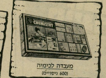
מעבדה לכימיה (600 ניסויים)