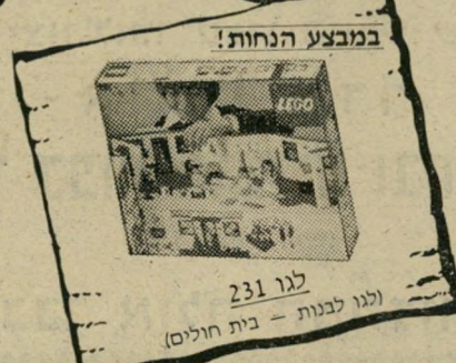
במבצע הנחות! לגו 231 (לגו לבנות - בית חולים)