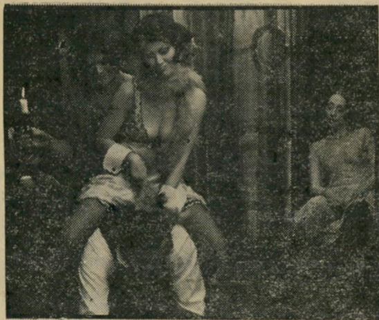
נשים הונגריות: יפות וגם חמות

דקים של הטבע האנושי, בסיפור שעיקרו מהתלה, על יצאויות שמסתירות בחיקן סטודנט חופשי, כשאמו באה מן הכפר, לבקרו. העלילה מספרת על דמויות ועל אורח חיים שצבד עליהם הקלח, ועם כל הנימה הביקורתית כלפיהם, יש בסרט מן נוסטאלגיה ל"נועם החיים שלפני המהפכה" כדברי טאליראן.