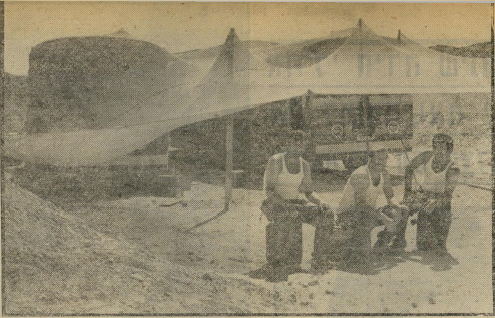
אוטובוסים של "אגד" ונהגיהם במערך יום-הכיפורים מילחמה רק על אספלט?

שאלה: האם מדינת ישראל צריכה לרכוש את האוטובוסים היקר ביותר בעולם, מרצדס? אין ספק, כי אוטובוס זה הוא הטוב ביותר עבור הנוסעים ועבור הנהגים, חברי אגד. אולם גם מכונית רולס-רויס היא הטובה בעולם, וי אין השרים מעזים להשתמש בה. האם מדינת-ישראל, בעלת חוב היצוני של 14 מיליארד דולר, צריכה לרכוש דווקא את האוטובוס הטוב והיקר בעולם?