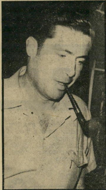
מנכ"ל שילוו נחיות, לא ביטחון המדינה