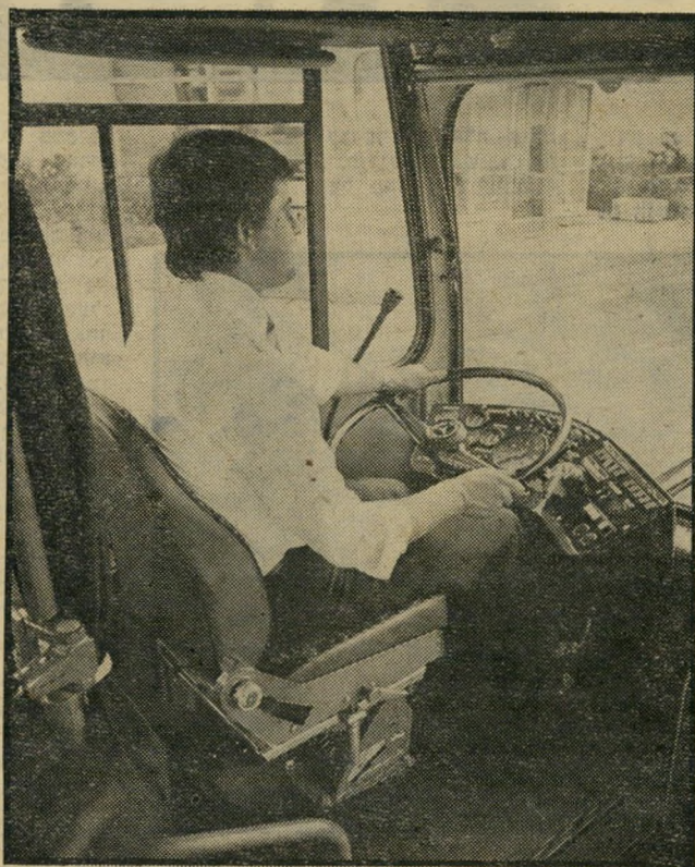
מושב הנהג ב"מרצדס" טוב לקראת הבחירות

היה קשה לי להאמין לדברי בוגין. אולם כאשר שאלתי בעצמי את שילו מדוע לא הביא בחיבוך את הגורם הביטחוני בעת רכישה, השיב: "אני דואג לסב