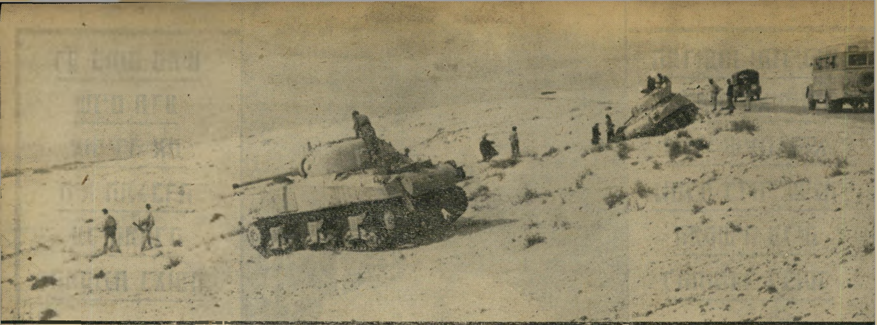
אוטובוס של "אגד" במידבר סיני במלחמת יום-הכיפורים האם הוא יוכל לרדת מכביש האספלט?

אים ברגל ליעדיהם. בינתיים עלול הקו ליפול.