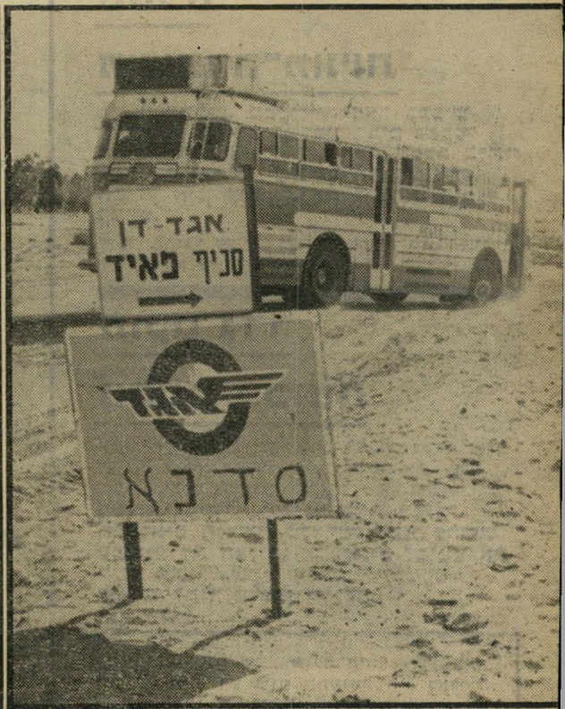
"אגד" כפאיד במילחמת יום-הכיפורים - "מרצדים" כפארים שעות העלולה לגרום לשואה