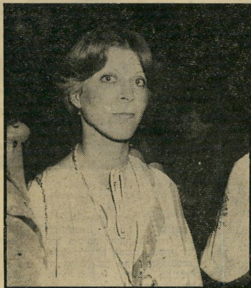
נופעת ליאורה לנדאו רגן ארוחות?

ע ל הוצאות השהות מסרב לנדאו לדבר. "אם אני אוכל ארוחות על חשבון האשתי של משרד החקלאות, מותר לי גם להזמין את אשתי" טוען לנדאו. החקלאות, אינן לי תגובה. העברת כספים מסעיף תקציבי אחד של משרד החקלאות לסעיף תקציבי שני היא לא עניין של העיתונות ואפילו דווקא עכשיו, אחרי הנסיעה, זה עניין של מיקריות. כל דבר בחיים זה מיקריות. אריק שרון לא ביקש מוועדת הכספים של הכנסת תוספת תקציב של 300 אלף לירות. הוא בסך הכל רצה להעביר מסעיף אחד בתקציב לירות לסעיף אחר. בסעיף האחר נשארו 300 אלף לירות ובסעיף הנסיעות לחוץ-לארץ היו חסרים 300 אלף לירות. אני לא מוכן למסור על כך פרטים. אתה לא מבקרהמדינה ואני לא חייב לך תגובה."