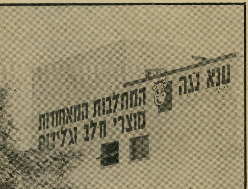
"המחלבות המאוחדות" של מישפחת השד, זיטכון של 1.2 מיליון לירות בשנה

מועצת החלב, נציגת יצרני-החלב, מת גגדת לכל צימצום ורוצה לפתור את בע יות עודפי-החלב על-ידי ייצוא אבקת- חלב וחמאה. אלא ראה זה פלא: כאשר מישרדי-האוצר תובע הקטנת ייצורי-החלב, והוא מעודד ייצוא עודפי-החלב, אין מונעים נציגיו ייבוא של אבקת-חלב מאירופה. מכיוון שמחיר אבקה מיובאת זול ב-12 אלף לירות ממחיר האבקה המקומית, טב עי, כי יצרני מוצרי-החלב יעדיפו לרכי שה. בין הרוכשים גם המחלבות הפרטיות המשמשות הרבה באבקת-חלב, וביניהן גם המחלבות המאוחדות, השייכות לבניו של שר-האוצר. למעשה מוציאים את רשיונות-הייבוא לאבקה חלב מישרדי התעשייה והחקלאות. אולם מועצת-החלב מנהלת את דיניה