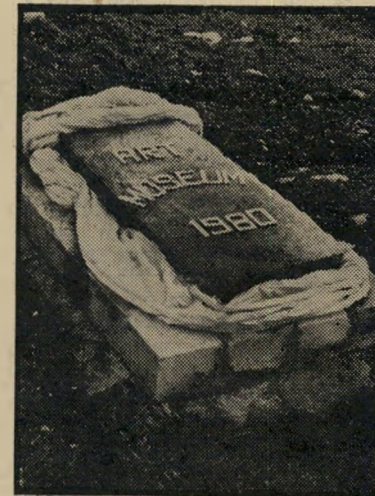
המופואון של ירדני בית-קברות לאומנות