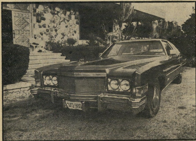
קאדילאק הפיתוי "בשביל הבן שלי"

"קנה את הספר יש עתיד וסע עם פלאטו למישק הכדורסל בבר-לין". קראו מודעות הפירסום הגדולות של חברי-כנסת הגנדרן. "קנה את הספר יש עתיד וזכה בקאדילאק של ח"כ פלאטו שרון". קראו מודעות אחרות.