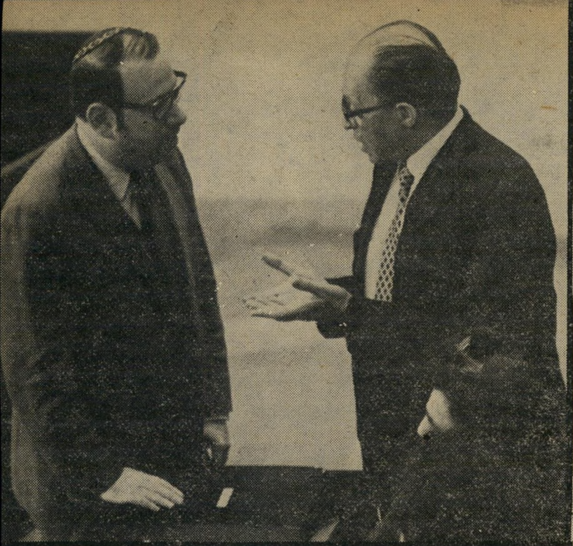
בגין וכו"מאיר הצעירים הבטיחו