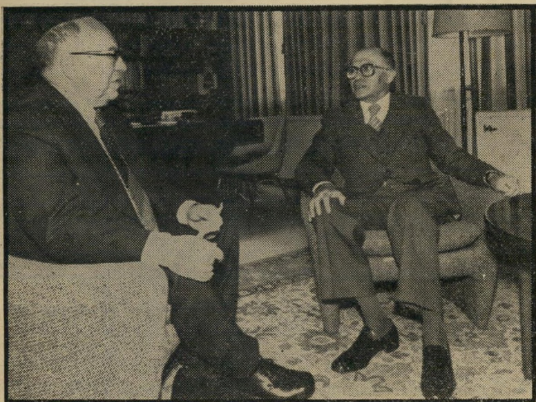
בגין ובורג המנהיג הסכים