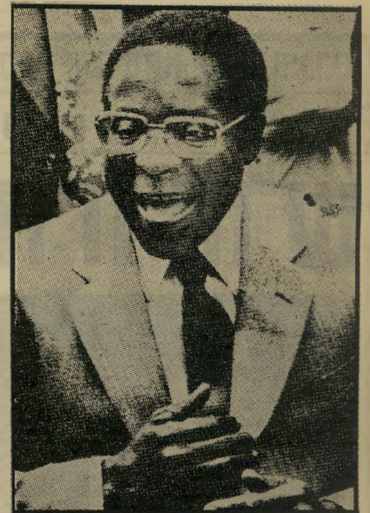
מנהיג זימבאבוה מוגאבה לא רוצה בסמית

מוגאבה רציני יש להזכיר שמתיונותו הטקטית של מוגאבה אינה מרמזת על נטישת עקרונותיו המהפכניים. חרף סיגנונו הכמעט סוציאלי-דמוקרטי, חותר מוגאבה לשיי בויים מיבניים מהותיים בזימבאבוה. הוא מקווה לחקות את ג'ובר, הנאי קוואמה נאקרומה, בגיבוש השילטון הפוליטי, לפני שייגש למהפכה החברתית-כלכלית. כמו שכנותיו ה-מרכסיסטיות, אגולה ומוזאמביק, יהיה מוגאבה פרגמטי במדיניות-החץ שלו, בעיקר כלפי דרום-אפריקה. אלא שאין לטעות בנחישות החלטתו להשליט מישטר של צדק חברתי בארצו. מדיניותו תושחת על רפורמות קרקעיות, חינוך אוניברסאלי חובה וחינם, וגיוס המשאבים לכך מהמשק הרודזי כולו. ניצחונם של רוברט מוגאבה זיכה את ארצו במנהיג גדול, בעל יוקרה בינלאומית ונקי משחיתות. הקיצוניים הלבנים זוממים עדיין הפיכת נגד. יש להניח, כנראה, שהפיכה כזו לא תמומש. ניסיון לשנות את העובדות שנוצרו בשטח ככוח ימיט שואה על הלבנים בוימבאבוה. אלה מהם המוכנים להשלים עם שלטון שחור, יישארו ויתנו ידם לבניית האומה החדשה. הגיוענים האמיתיים יצטרכו, במקדם או במאוחר, להגר. בחירתו של מוגאבה מבשרת את השלב הלפני האחרון במילחמה נגד הגיוענות באפריקה. מועד מאבקי ההסחה תם. עתה תינטש המערכה כולה ברפובליקה הגיוענית של דרום-אפריקה.