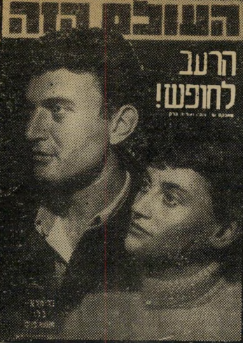
העולם הזה 910 תאריך: 24.3.1955