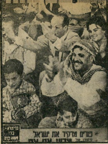
"העולם הזה" 909 תאריך: 17.3.1955

הפכה תחליף למדיניות משני הצדדים, הי סכנה שתוך כדי כך ירד הצד הנאור יותי לרמתו הפראית של הצד הנחשל. כל נוקם, בסופו של דבר, הוא סכאי של הרג. זה תפקידו החברתי. מייסדי הר פלמ"ח הבינו זאת היטב, והשתדלו לכוון משקל-נגדי עליידי סגידה לערכים שזו סריים מיוחדים, שיוקנו לחייל תוך כדי הקניית מלאכתו הנוראה. מדינה החייה במצב של מילחמה מתי מדת, אינה יכולה להרשות לעצמה לזות על חינוך זה. כי אוי לנצחון בקרב אשר קורבנו הראשון הוא דמותם הרוחנית של בעליו.