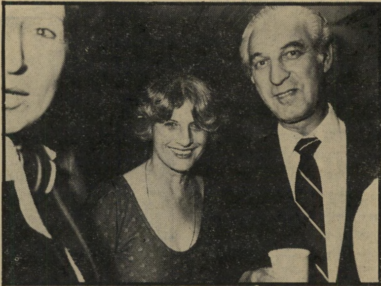
פרופסור שר מיספר 6

24 גברים ישראלים מפורסמים לבושים בחוסר טעם ו-13 גברים נוספים הם מיקרים גבוליים בכל הנוגע לאופנה. כל זאת מתוך רשימה של 56 גברים שהוצגו בפני האופנאים. הגבר הישראלי נמצא בין ח"כ יצחק ברמן, הלבוש בטעם הטוב ביותר מקרב האישים הישראליים, לבין שרי החקלאות אריק שרון, שהוכתר כאיש הי לבוש בחוסר הטעם הבולט ביותר.