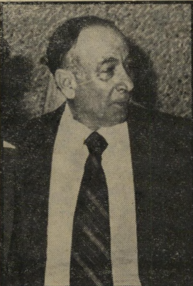
שריאוצר הורביץ מיספר 6 מינוס