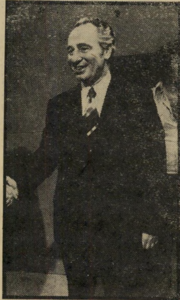
ח"כ פרס מיספר 7

שריחמישפטים שמואל תמיר לבוש כהלכה, אולם האופנאים מציינים כי חלה