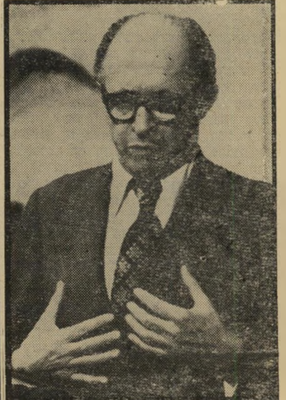
ראשיממשדה בנין מיספר 4 מינוס