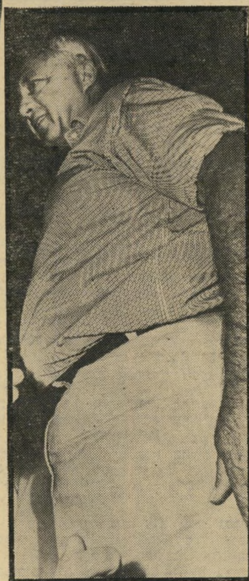
שרי-חקלאות שרון מיספר 1 מינוס

במקום השלישי צועד ח"כ משה דיין, שריהחוק לשעבר. אשתו של דיין, רחל, זכתה במקום הראשון ברשימת הנשים ה- לבושות בטעם במישאל העולם הזה. יש להודות כי בשנים האחרונות, מאז נישא לרחל, לבוש דיין הרבה יותר טוב מאשר קודם לכן. הוא החל ללבוש חגורות ונמנע מלמשוך את מכנסיו כלפי מעלה, עניבותיו תואמות לחליפותיו ואינו זוכה עוד להגדרה