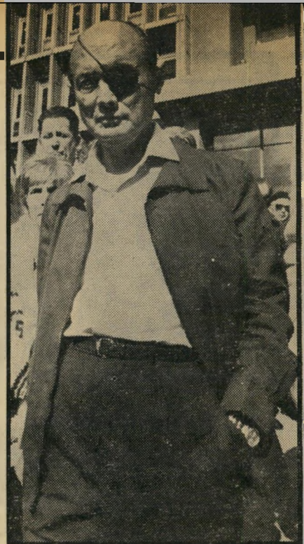
ח"כ דיין מיספר 3 מינוס

אחרי שרון, במקום השני, צועד ח"כ אבא אבן. חטאו של אבן כפול ומכופל, מאחר והוא כיהן כשר-החוק וכשגריר ישראל באו"ם. לדעת האופנאים חליפותיו של אבן מיושנות. „הוא נראה חנוט, לבוש כמו ראש-ממשלת-בריטניה במאה שעברה.“ אבן מקפיד להופיע רק בחליפות ועניבות.