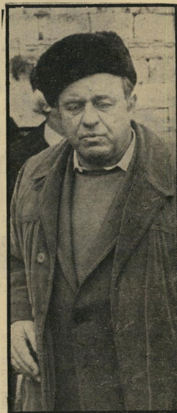
ראש-עיר קולק מיספר 5 מינוס