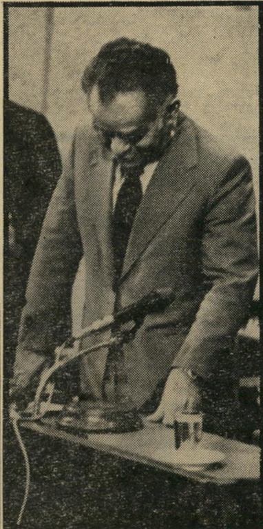
יו"ר שמיר מיספר 9 מינוס