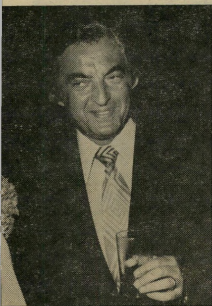
ח"כ פלאטו-שרון 5 מיספר 1990

הקומה הגבוהה והגוף האתלטי, לבוש ביי קפידה רבה, בסיגנון הספורט-אלגנטי. בכג" דיו שולטים צבעי האפור והחום. רעייתו סווגה דווקא ברשימת הנשים הלבושות בצורה סבירה, אך בלתי ראויה לציון מיוחד. הד"ר אליהו (אלי) בן-אלישר תופס את המקום השלישי. האופנאים אינם אוהבים את סיגנון הלבוש הקפוא של בן-אלישר וטוענים כי החליפות השמרניות מוקינות אותו, אך אינם יכולים שלא להודות שהוא לבוש באלגנטיות רבה ובקפידה רבה. מאז נבחר בן-אלישר למנכ"ל מיש"ר רד-ראש-הממשלה, התפקיד שבו נשא לפני שהיה שגריר במצריים, לא נראה בן-אלישר ללא חליפה ועניבה.