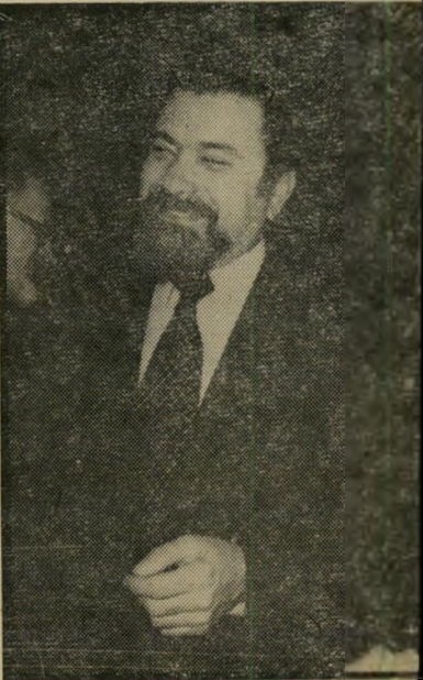
שגריר בן-אלישר 3 מיספר 1990