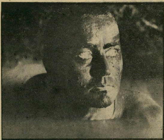
מרטיין שיין: אורגיה של זוועה

עם כל התוהו ובוהו של הסוף, כדאי מאד לראות את