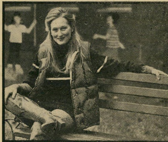
מריל סטריי: ממדים אנושיים

מול מריל סטריי ניצב דאסטין הופמן באחד מתפקידיו הטובים ביותר. דמות הקורבן שגונב את אהדת הקהל מצליחה הפעם במיוחד, ואפילו פמיניסטיות מושבעות יתקשו להסתייג ממנה. אשר לילד, ג'סטין הנרי, הוא תאוה לעיניים ולו רק משום שבנטון אינו כופה עליו חינחונים, חנופות ופרצופים מתקקים, אלא מניח לו להיות ילד.