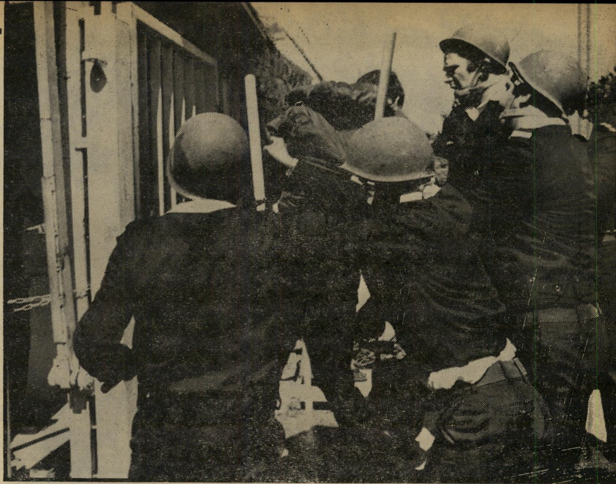
שער פולומבו כמעט התמוטט כאשר ההמון הסתער עליו וניסה להפילו. בהסתער על המפגינים לפנותם. בתמונה נראים שוטרים כשהם תופסים את אחד המפגינים ליד השער ומכים אותו באלותיהם. אותו זמן הסתערו אחרים על השערים הרגילים של הכנסת, והצליחו

25 אלף חקלאים מפגינים אימו על הכנסת בהפגנה הגדולה והאלימה ביותר בתולדות המדינה רק בנס נמנע מהמפגינים הזועמים להתפרץ אל תוך מישכן הכנסת ולעשות בו שמות