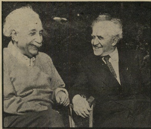
דויד בן-גוריון ואלכרט איינשטיין 14.3.1954

16.3 — הממשלה החליטה לציין מדי שנה את יום הקמת