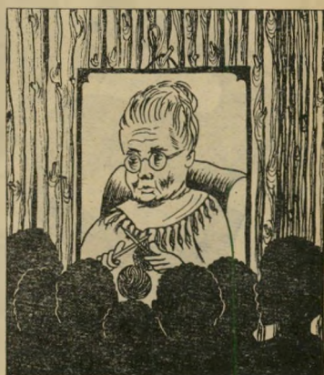
המחיר: 118 ל"י (כולל מע"מ)