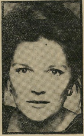
גברת קולומבו: מוליגרוי שבת, שעה 10.05

החתונה (6:02). סרט ערבי תוצרת מצרים המוכיח שוב כי "אמא צודקת תמיד". בחורה צעירה מאהבת בצעיר אחר, אך אמה אינה מסכימה שהיא רופאית. האם מועידה לבתה רופא מכובד. הצעירה נישאת לרופא. אך על-פי הסכם, הוא אמנם בעלה באופן רשמי אך מרשה לה להמשיך ולנהל את הרומן שלה עם הצעיר. הזמן חולף עובר והצעירה מת-בעלה, ומגלה שאמה צודקת.