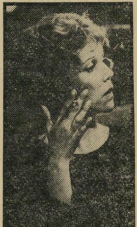
על אדונים: הוד יום רביעי, שעה 8.03