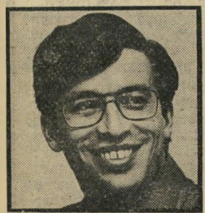
חטף פתח: קור יום שלישי, שעה 9.30

המרוץ אחר החגלי (9:40). פרק אחרון בי סדרה מצוינת זו, הפעם, שלא כשבוע שעבר, יופיע בה הי פרופסור קינגספילד. החל מי-