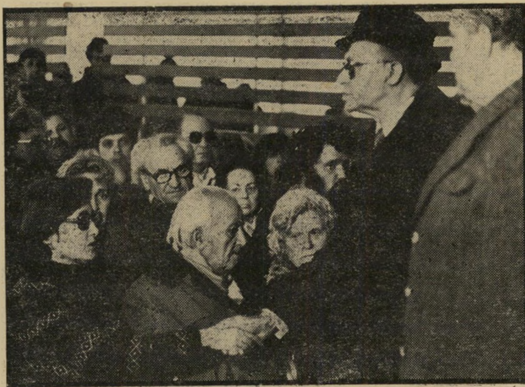
מנחם בגין מביע תנחומיו למושפחה — כי אז הלא נשא בעוז את כתר-המלכות —

יותר מכל סבל מן העויות בלחי, שהפריעו לכל הופעותיו הציבוריות. הוא עבר טיפולים רבים, הרכיב משקפי-שמש