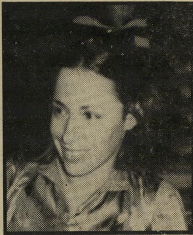
הקינאה לא הועילה