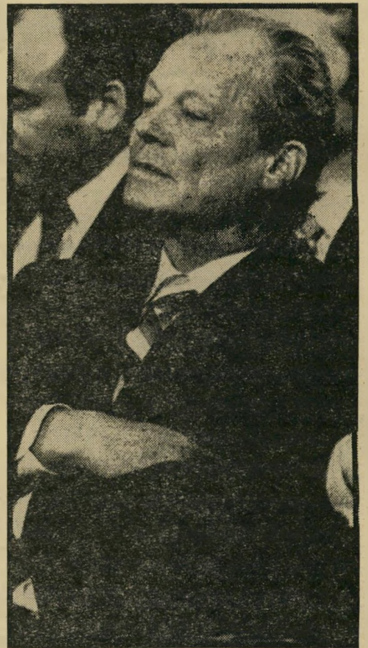
וילי ברנדט אדמה חרוכה ונוף מדולדל

עולם מציאותי. וילי ברנדט וחבריו אינם אוטו-פיסטים או אידיאליסטים חסרי-ניסיון, הצעותיהם רחוקות מלהיות מספקות, והניתוח שלהם אינו ראויקלי דיו. עם זאת הם חיים, כפי שמציין בצדק הסאנדיי טיימס, בעולם המציאות. החזון הגלובלי, וראיית המציאות המרה-כפי שהיא, מוציאים אותנו מהעיריה הפרובינציאלית ה-קטנה, תהיה זו חדרה, מנצ'סטר, קייב או פרבר ניר-יורקי, ומחזירים אותנו לראיית העולם כולו כיתידה אחת.