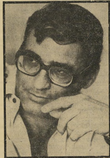
יעקב שבתאי התנגדות מתחננת של מילים