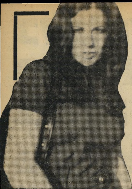
דיילת נצטר להיזהר מגניגות

שנתגלה בחברה, לא ראה שפטל מקום לטענה כזו נגד לקוחות. לכן הגיש תביעה לבית-הדין לעבודה, וביקש פסק-דין הצהרתי כי הפיטורין אינם תופסים. הוא טען שבמעשיה של לקוחות, לא היה משום מעילה באמון.