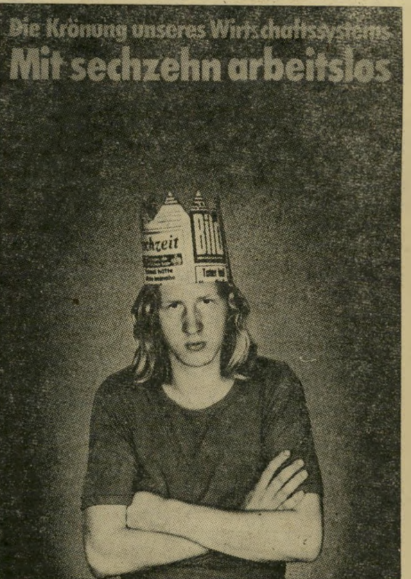
"מובטל בגיל 16"

מי שרוצה למות כגיבור, צריך להתאמן מגיל צעיר