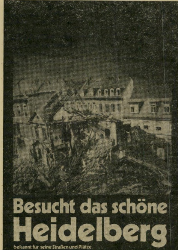
"בקרו בהיידלברג היפהפיה"

פלאקאט אחר, שלא הוצג: ילד משחק בנשק-צעצועים, על רקע של חייל-גרמני הנהרג במילחמה. הכותרת: "מי שרוצה למוות כגיבור, צריך להתאמן מגיל צעיר." במיקרה לובש הילד חגורה שעליה מת-ניסס אבוס דמוי מגן-דוד, וואסנר חשש שמא יראו בכך כוונה. מילחמות וירוקים. למנהל הצעיר יש תוכניות רבות ליצירת קשר חי יותר בין התרבות הגרמנית החדשה וישראל. מאז הקמתן של ישראל והרפובליקה הפדרלית הגרמנית התרחקו שני העמים, לדעתו. לגרמנים קשה להבין את המישקע שנוצר בארץ בעיקבות המילחמות בערבים, ואילו הישראלים אינם מבינים את המישקע שנוצר צר בגרמניה בעיקבות המהפכה של הר-סטודנטים של 1968 והתנועה האקולוגית החדשה (הירוקים). יש למנהל עוד בעייה: העל הרישמי של המוסד הוא מכוון גתה, על שם הסופר הלאומי הגרמני, וולפגאנג פון-גתה. אך כמה ישראלים יכולים לבטא את השם הזה?