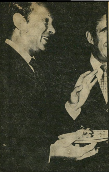
שר מודעי תביעה להכחשה

תחילה רצתה חברת-החשמל לבנות מזח-פריקה לפחם ליד התחנה, בצורה שמי-רנית, ולהגן עליו בשובר-גלים. שובר-גלים לבדו היה צריך לעלות 50 מיליון