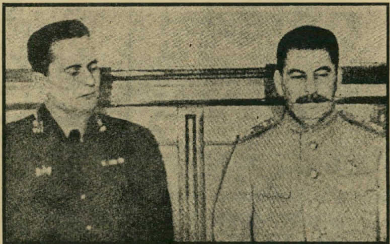
טיטו עם סטאלין (1945) יגא אלון הבטיח

בשלו ובגשם, לעמוד בקרבות-פתע, כש-לא היה הבדל בין המפקדים והלוחמים. טיטו עצמו נפצע. הוורמאכט המהולל לא הצליח לגבור על הפרטיזנים, למרות הפעלת שיטות של זוועה. בתום המלחמה, יכלו היוגוסלבים להכריז, בצדק, שהם העם האירופי היחיד שהצליח לשחרר את עצמו בשדה-הקרב. יוסי מכה את יוסי . לעובדה זו היה תה השלכה חשובה ביותר על ההמשך, שהפך את טיטו לדמות בינלאומית, גיי-בורם של כל העמים הקטנים בעולם. ארצות מיוזרח-אירופה שוחררו מעול ה-נאצים על-ידי הצבא של סטאלין, והרודן האדום לא חלם להעניק להם חרות. הוא לא כפה עליהן רק מישטרים קומוניסטיים, אלא גם נטל ממישטרים אלה כל קורטוב של עצמאות. רק בארץ אחת הוא נתקל בקושי. טיטו לא ראה בסטאלין משחרר, אלא לכל היותר בעל-ברית. עוד בימי המלחמה דאג טיטו לקשור קשרים אמיצים עם בריי (המשך בעמוד 31)