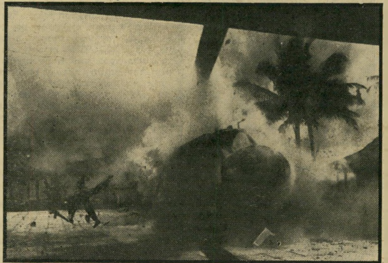
„אפוקליפסה עכשיו“: פרשי-האוויר תוקפים את הכפר

רגע אחד - שלווח עמוקה. ילדים יוצי-אים מבית-ספר. מורה צעירה וחייכנית מפקחת עליהם. איכרים עובדים בשדות. נשים מוכרות ירקות בשוק. כמו ולפתע - להקת מסוקים, כמו