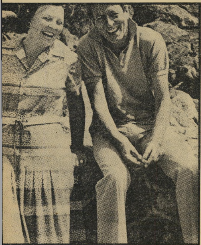
הנסיכה ביאטריקס ובעלה קלאוס במעון-הנופש שלהם באיטליה. החיוכים המשותפים הדביקו את העם.