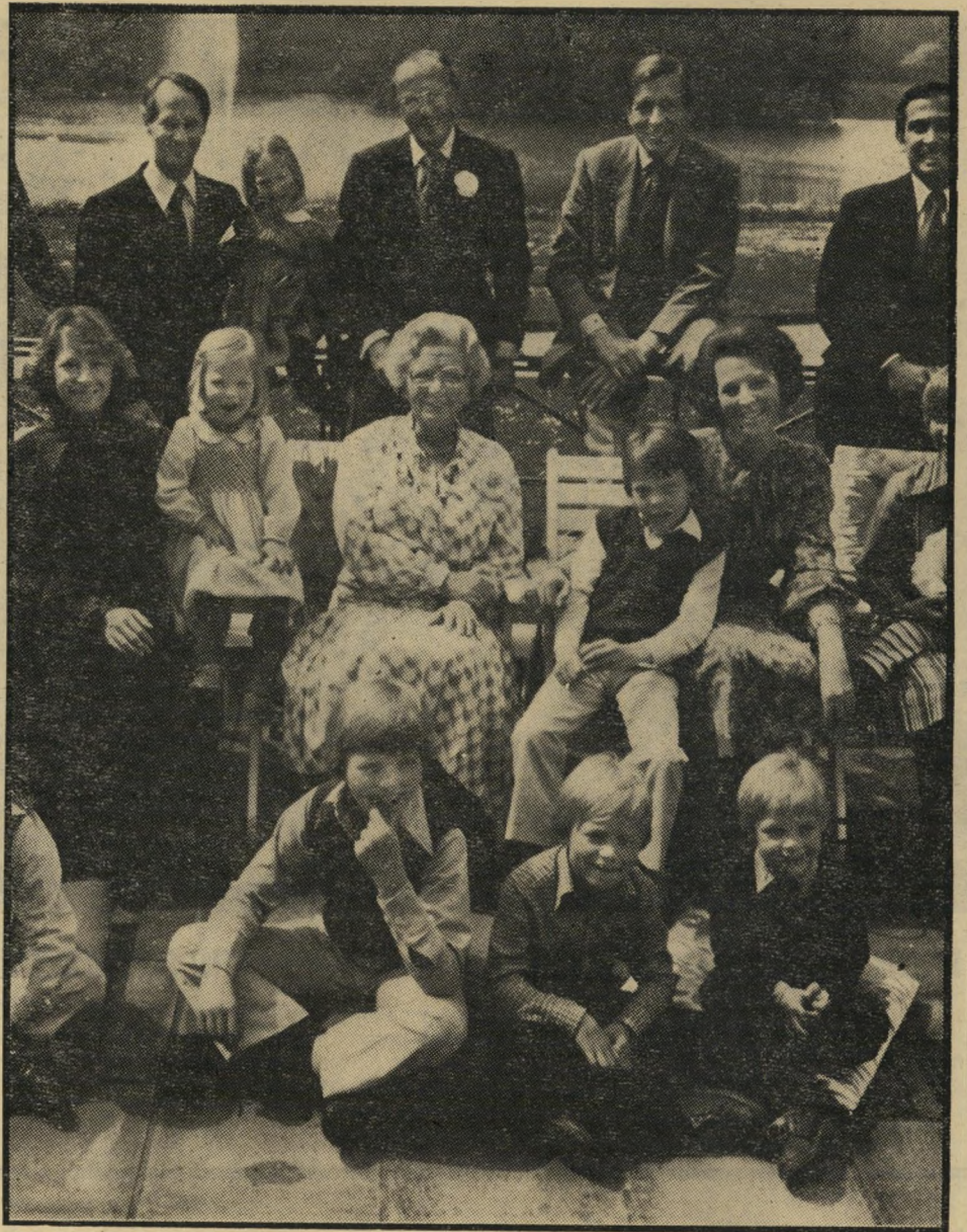
המלכה יוליאנה ובעלה ברנארד (מעליה), ביאטריקס (משמאלה), בעלה קלאוס (מעליה), הנסיכה מריה ובעלה קרלוס (מעליה) וילדיהם (מסביב).

כשנשאה המלכה יוליאנה את נאום הפרידה הנרגש שלה מכס המלוכה ההולנדי, היא ידעה היטב מדוע זלגו הדמעות מעיניה. העם בארץ השפלה הביע, לא אחת, את הסתייגותו מירשת הכתר. הנסיכה ביאטריקס, על שנישאה, למרות מתאתו, לדיפלומט הגרמני קלאוס פון אמסברג. (בתמונה העליונה נראים השניים ביום נישואיהם ב-10 במרץ 1966). קלאוס הואשם בהשתייכות לפלוגות הסער של היטלר, ולאחר מכן לוורמאכט. "הייל קלאוס!" שאגו ההולנדים כשמרכבת הזוג עברה ברחובות אמסטרדם, ופצצות מחאה הובערו מכל עבר. אבל יוליאנה לא ויתרה על שום הזדמנות רישמית להוכיח מי יירש את הכתר, ולאט לאט התרגלו ההולנדים לכך שביאטריקס תהיה מלכתם, ואולי נרגעו עקב אושרם המישפחתי של בני הזוג והתנהגותו הסימפטית של קלאוס.