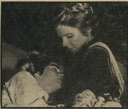
קלייבורג וברי: הופעה מרהיבה

עד כאן מיקרה קליני, שאנשי מיקצוע בוודאי מכירים רבים כמוהו. מכאן והלאה מתחילות הבעיות. בהדרגה הבמאי לארי פירס הופך העולם המסובב את הצעירה לעולם פשטני, גס ואלים שהטירוף מתבקש מאליו, ומותר אפילו לחשוך בשאלה שאינם משתגעים, אינם נורמלים. אם מזובר בסידרת נסיבות חסרות-מזל שנפלו בחלקו של אדם מסויים אחר, הרי יש לסרט עניין מוגבל ביותר, מאחר שאין לו מה לומר למי שאינו ביש-מזל עד כדי כך. אם הסרט אמור לצייר את תמונת פני העולם, הרי מאחרי