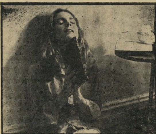
התמוטטות נפשית: עניין מוגבל

פור צריך להתחיל, מסתבר שאין בו אלא תועלת אחת: להעביר את הצופה אל האפקט הבא. וההמתנה לאפקט זה יכולה להיות מעייפת למדי וחסרת עניין לחלוטין.