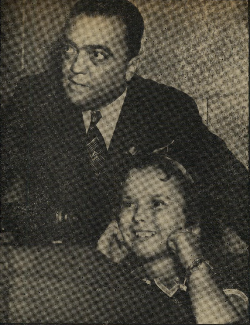
ידרת פלא שירלי טמפל וראש אפי-ביי-איי, אדגר הובר כך מחבבים את שילטון החוק

היום הזה. ובמיוחד עתה, כאשר כלכלתה ניצבת בפני סכנה. לכן מובן מדוע כל התכונות באירועי אותם ימים היא בעלת משמעות מיוחדת בהווה. ומשום כך אי- אפשר שלא להמליץ על סרט, הנושא את שם השיר המפורסם, שיוצג בקרוב במור זיאון תל-אביב, במסגרת אירוע רכנוני, המוקדש כולו לאמנות האמריקאית.