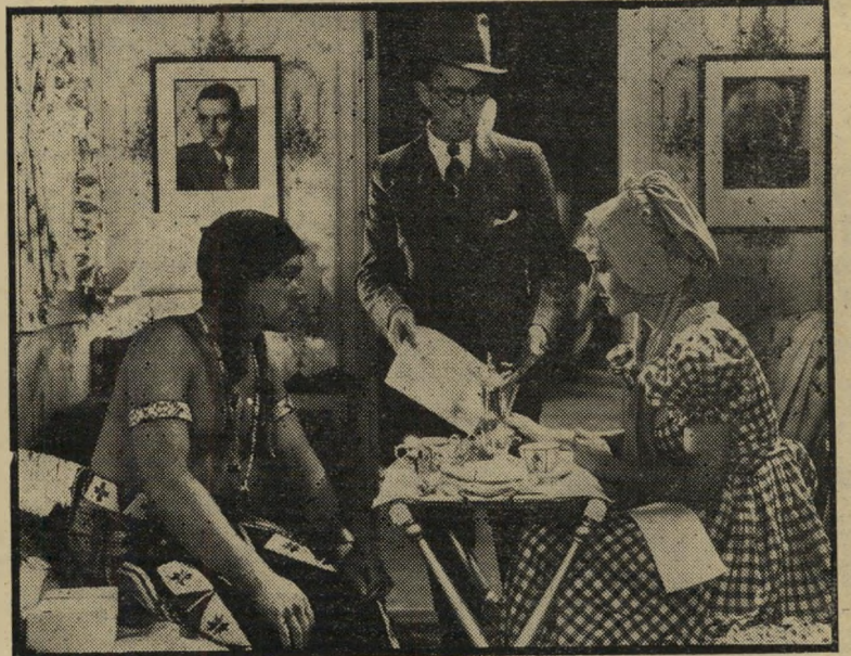
ג'יימס קאגני ב„אחי האם תלווה לי פרוטה“ כך זוכרים את הזמנים המרים

פילים מורה. לכאורה זהו סרט תיעודי, אבל מה שמעניין בו במיוחד היא העובדה שהזמר הגלם העיקרי בו הם סרטי קולנוע. כי מה שמורה מנסה להשיג, זו תמונה של שנות השפל, כפי שהן השתקפו לא רק ביומנים ובמיסמכים תיעודיים מ- אותה תקופה, אלא בעיקר בסרטים ש- עשתה הוליווד למען הקהל הנתון במצוקה. מה עושה מורה? הוא נוטל את ושלד ההיסטורי, משתמש בקטעי יומנים קיי- מיס, בצילומי עיתונות ובהרבה הרבה שירים שנכתבו באותה התקופה.