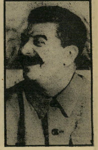
רוזן סמאני 14.2.1950

פיגמליון של ג'ורג' ברנרד שאו קוצר הצלחה כמחזמר בשם גברתי הנהווה. שתי הגירסות הוצגו בישראל. הסרט קוו ואדים תורם להעמקת הש' פעתו של הראינוע האיטלקי.