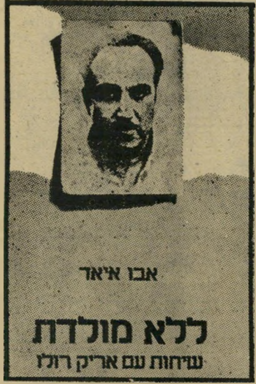
ספרו של אבויאיאד רפול ועראפאת