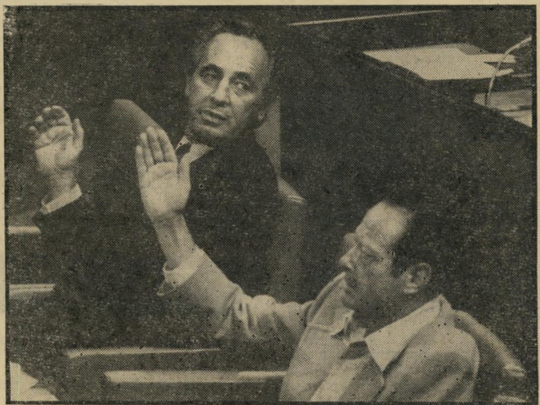
חכ"ם אלון ופרם מה אחר מי על מי?

אין מדורים אלה באים לגרוע מאר" מה משאר מדורי העיתון, העוסקים ב" נושאים רציניים יותר. אילו עשו כן, היה בכך חטא.