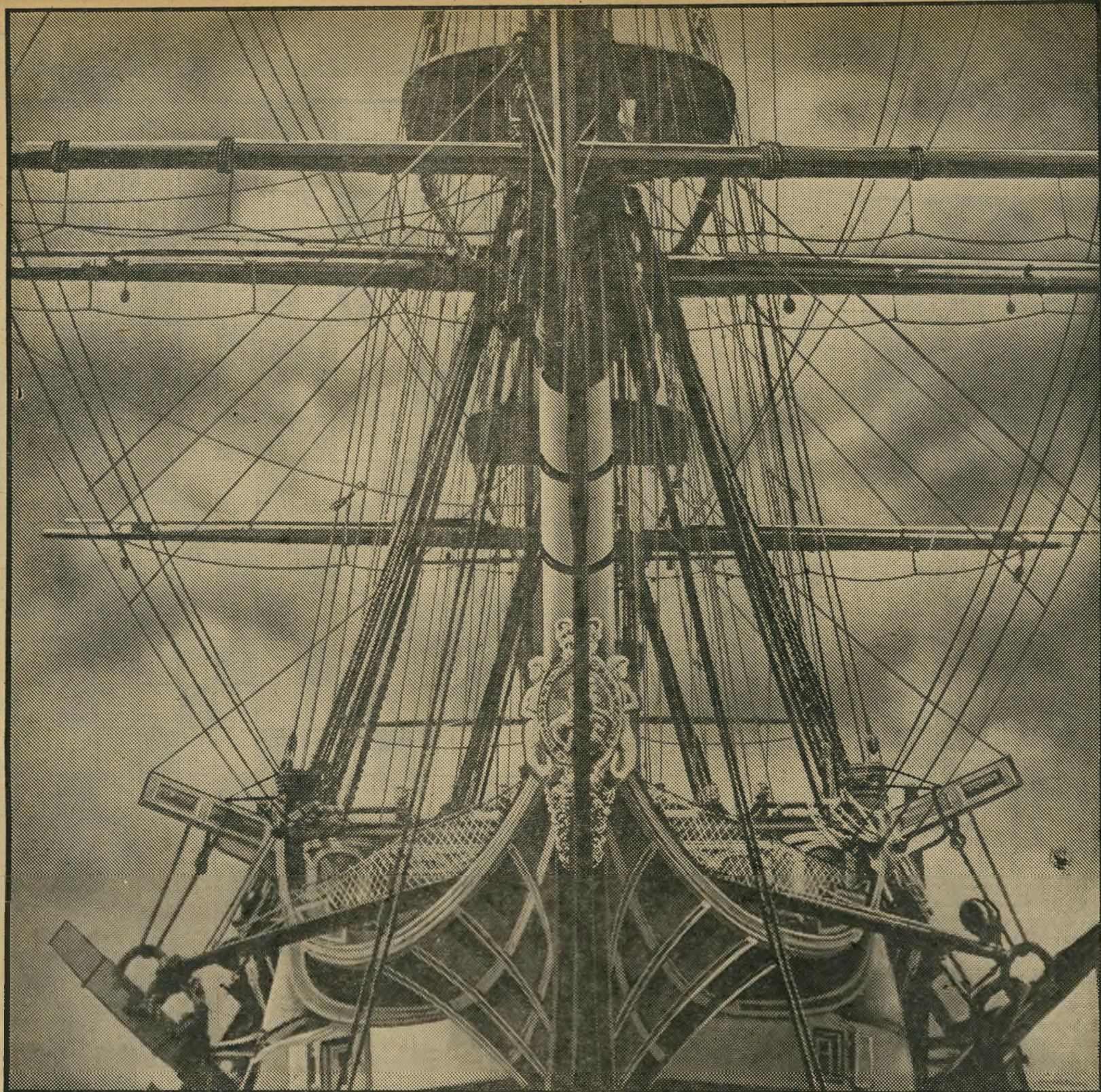
„ויקטורי“ ספינת הדגל של גלסון